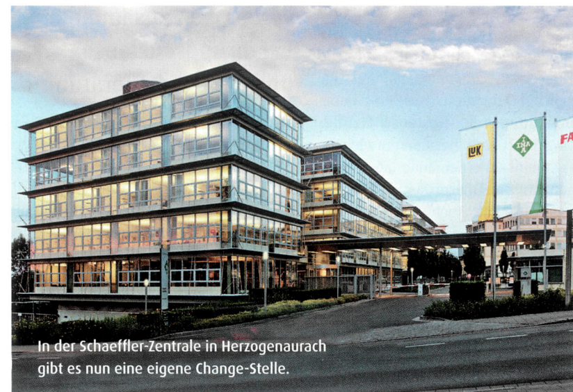
In der Schaeffler-Zentrale in Herzogenaurach gibt es nun eine eigene Change-Stelle.

In einem ersten Schritt wurde das Personalmanagement hierarchieübergreifend qualifiziert. Im weiteren Verlauf weitete man die Zielgruppe auf alle Führungskräfte des Unternehmens aus. Verschiedene Seminare wurden konzipiert, die Lerninhalte blieben dabei für alle gleich. Die Teilnehmer lernten aus ihrer jeweiligen Rollenperspektive, wie der Prozess aussehen sollte, in dem